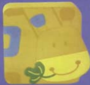
Nachtlicht Giraffe, 19,95 Euro, www.kinderdinge.de