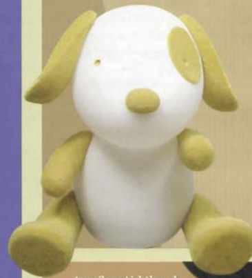
Lumilove Lichthund, 49,90 sfr, www.kidsworld.ch