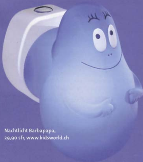
Nachtlicht Barbapapa, 29,90 sfr, www.kidsworld.ch