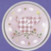
Nachtlicht Willkommen, 4,95 Euro, www.kinderlampenland.de