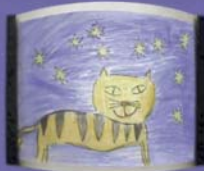
Solar Kindernachtlicht, 34,90 Euro, www.quantys.de